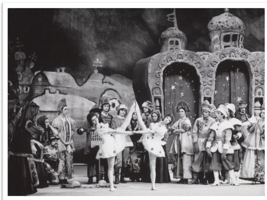
18.03.1973, Teatr Wielki w Warszawie, balet Pietruszka