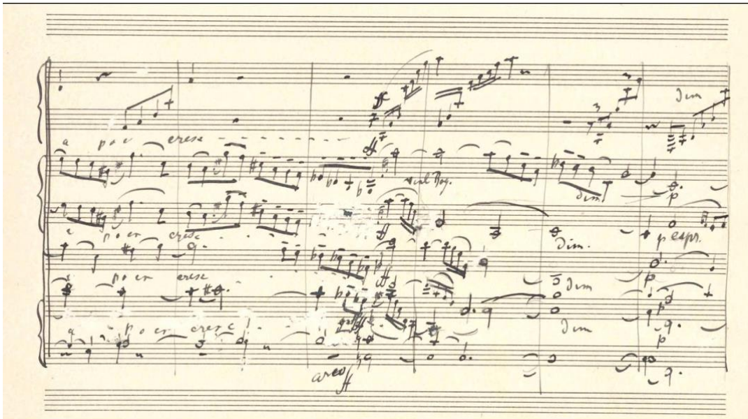
Gustav Mahler - Symphony no. 5 "Adagietto"