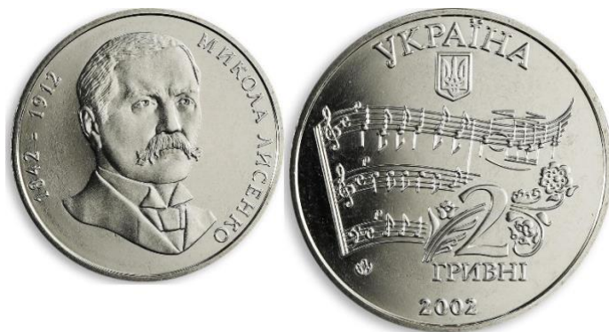
2 hrywny Mykola Łysenko