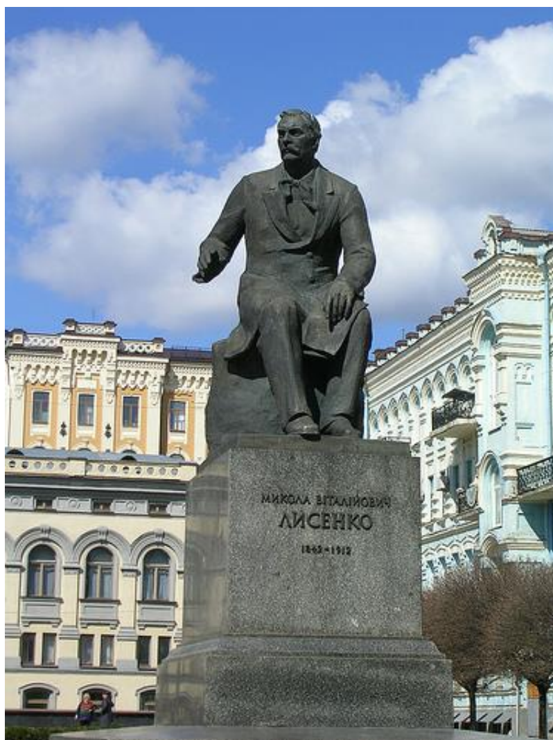
Pomnik Mykola Łysenko w Kijowie