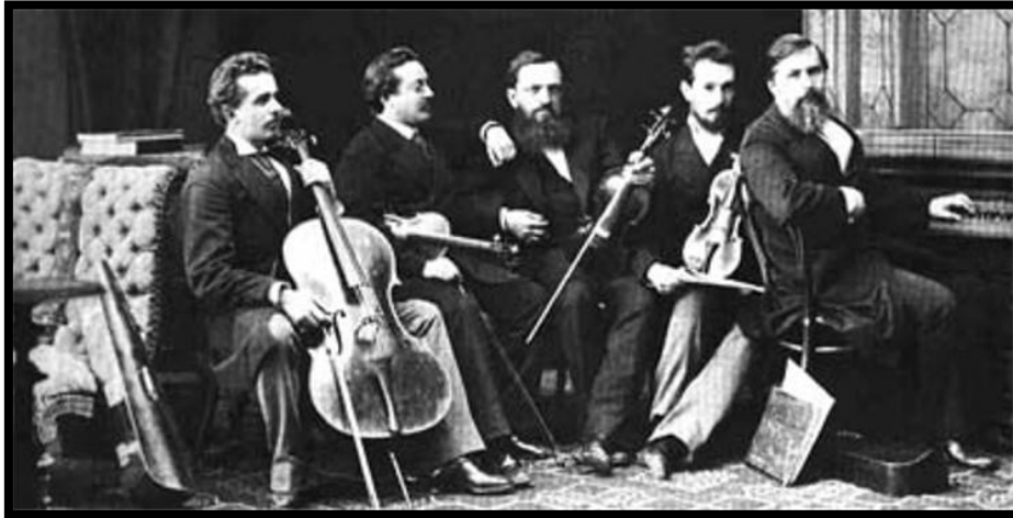
Mykoła Łysenko w kwintecie muzyków Filharmonii Kijowskiej (początek XX wieku).

Na początku XX wieku Łysenko skomponował muzykę do dramatycznych spektakli „Ostatnia noc” (1903) i „Hetman Doroszenko”. W 1905 r. napisał pracę „Hej, za naszą ojczyznę”. W ostatnich latach życia Mykoła Witalijewicz tworzył szereg utworów z dziedziny muzyki sakralnej, kontynuując założony przez siebie pod koniec XIX wieku cykl „Cherubinów”.