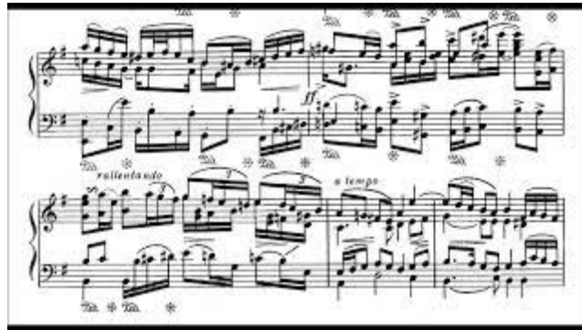
Mykola Lysenko - Song without words, Op.10/1