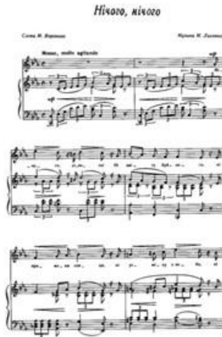
Mykoła Łysenko - Нічого...

Swoje liczne kompozycje wokalne Łysenko opierał na tekstach przeważnie ukraińskich autorów. Gdy zaś kompozycja opierała się na poezji twórców zagranicznych, na przykład H. Heine bądź A. Mickiewicza, to zawsze były ukraińskie tłumaczenia.