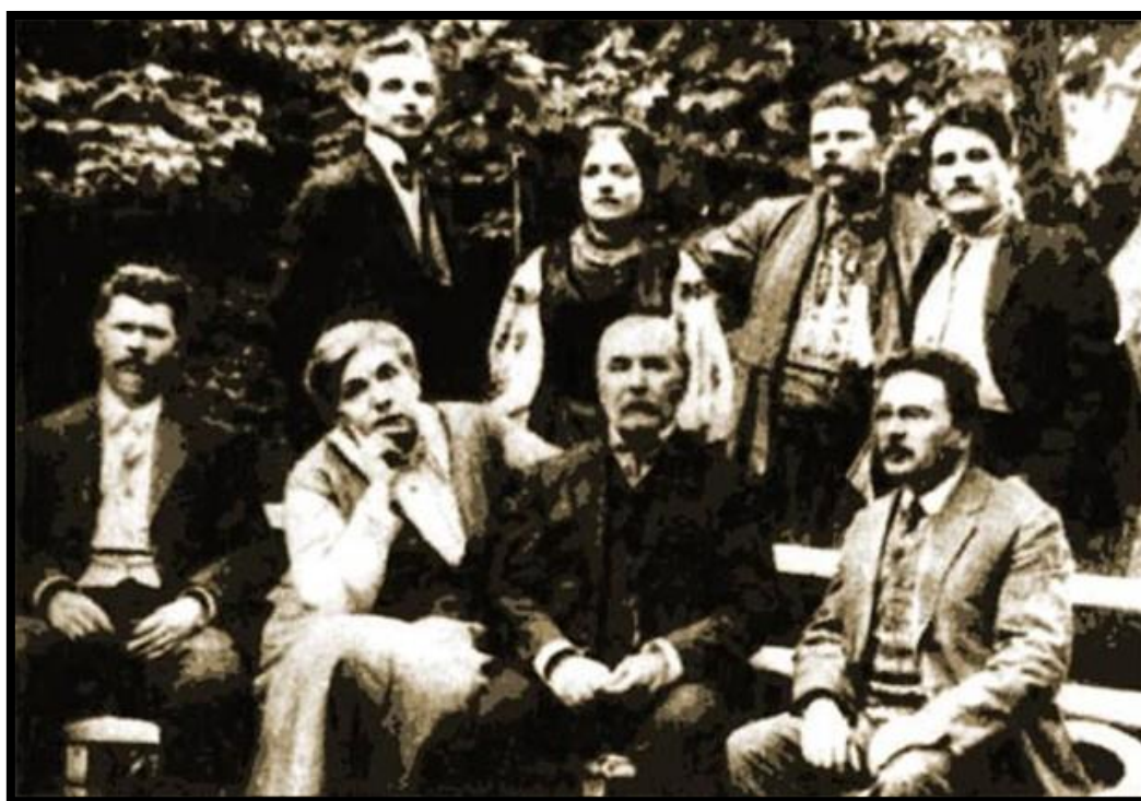
Mykoła Łysenko z wykładowcami Łysenka Szkoła Muzyczno-Dramatyczna .

W 1904 r. otworzył własną szkołę muzyczną i teatralną Łysenka Szkoła Muzyczno-Dramatyczna .